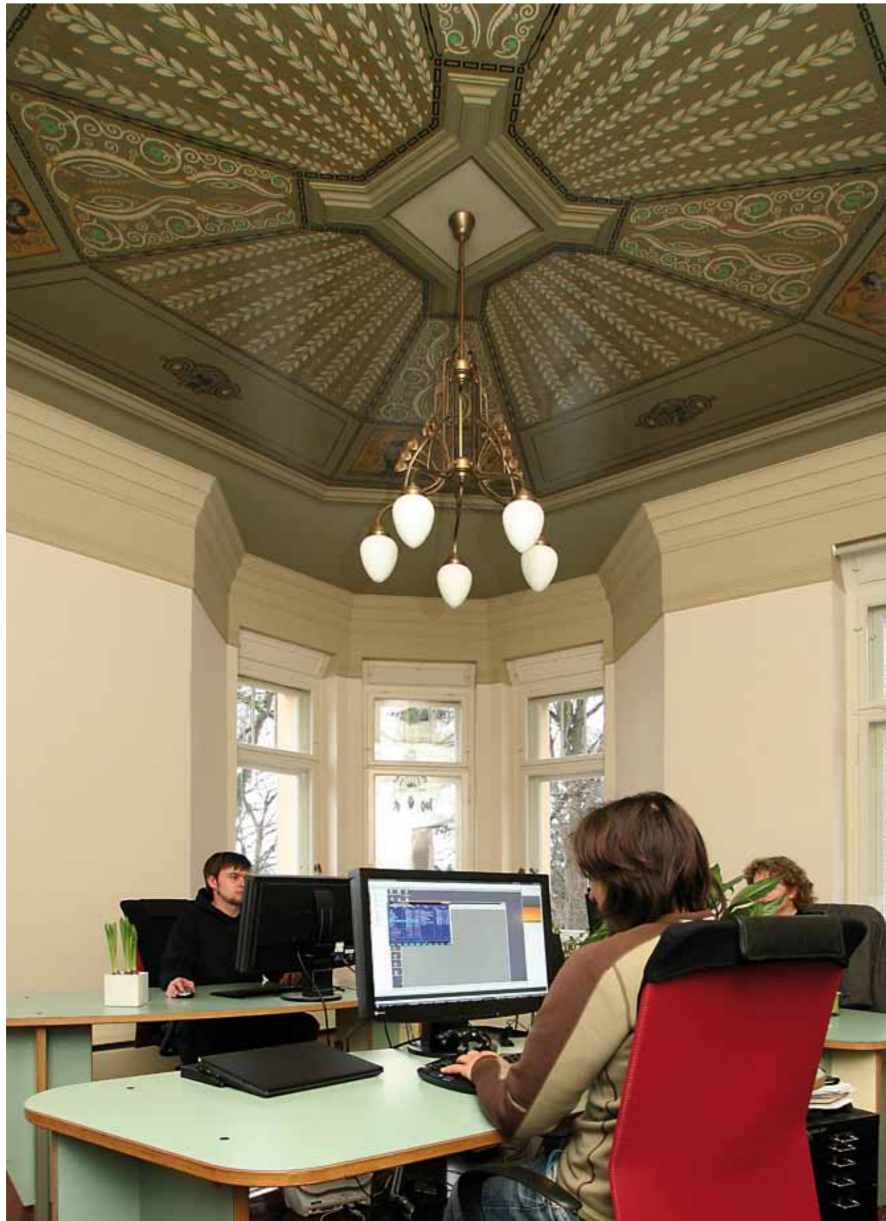
chemmedia: Wissen organisieren, Lernprozesse gestalten