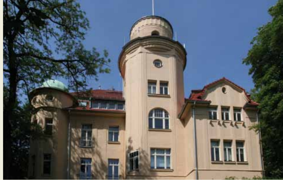
chemmedia-Zentrale: Villa Oscar Freiherr von Kohorn zu Kornegg