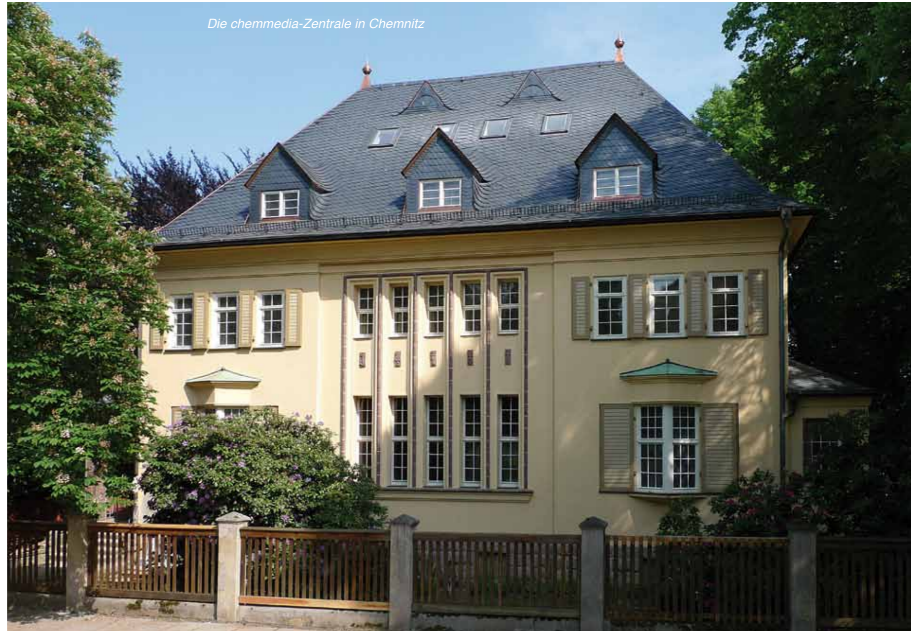
Die chemmedia-Zentrale in Chemnitz

It is all about movement with Microsoft Kinect which is the new controller for the paddle Xbox 360. Speed was asked for the product launch by “MediaMarkt“ and “Saturn“. Just in time for the market entry, the employees should familiarize with the product. Therefore, a training in 12 languages for 15 countries was